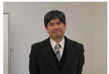
担当 数学/化学基礎

2016年もまだ始まったばかり。皆さん(もちろん私も含めて)の挑戦に幸多からんことを祈念する。