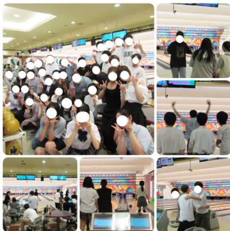
<7月：ボウリング大会>