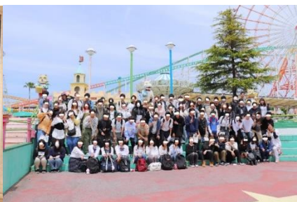
<4月：バス旅行（グリーンランド）>