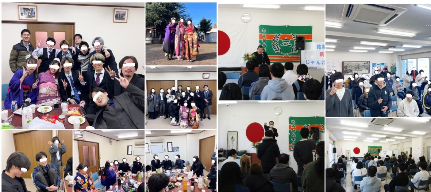
・2021年度卒業生の「二十歳の集い」(1/8)

年が明けたこの1月。志成館ではさっそく様々イベントや学習が行われました。今回はこの一月の行事の一部を振り返ってみます。それでは、レッツぐるぐるウォッチっち！